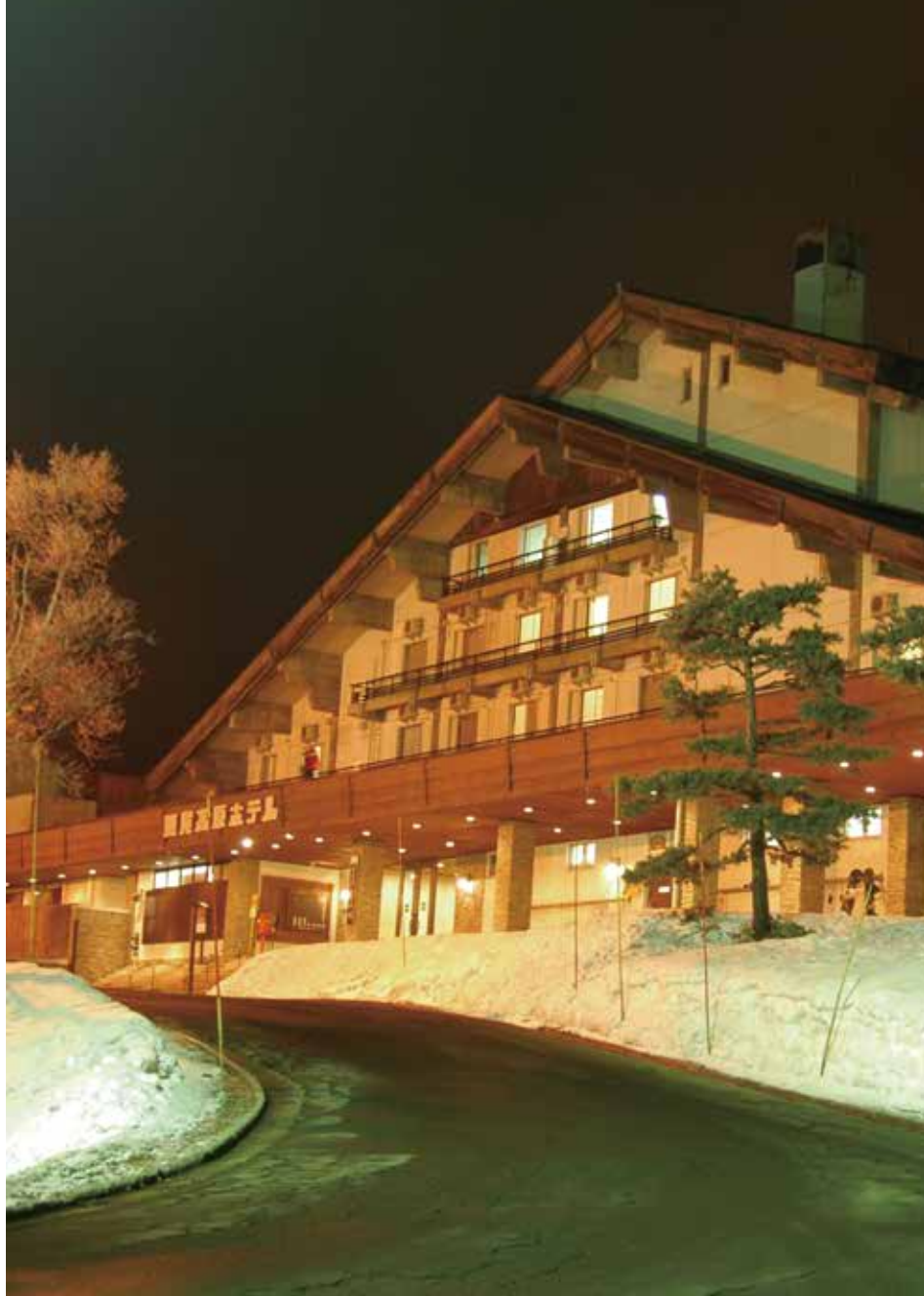
斑尾高原のシンボル 斑尾高原ホテル